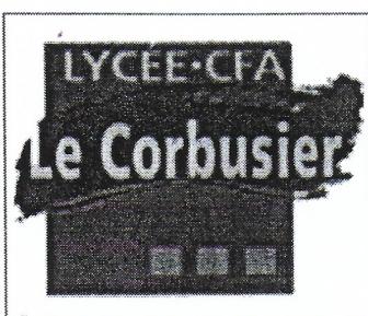
Logo du lycée